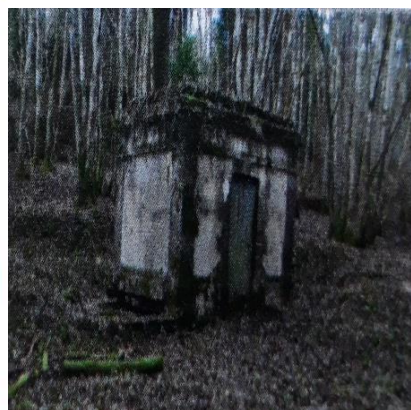
Local actuel du captage