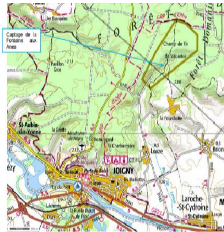
Situation géographique du captage

Captage de la « Fontaine aux Anes » - Commune de Joigny 89